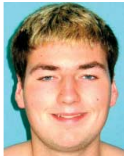
Abb. 1 Mit sichtbarem Erfolg abgespeckt: Patient bei Aufnahme (li.; 15 Jahre) und Entlassung (Mitte; 6 Monate später) sowie weitere 15 Monate später (rechts). Der BMI sank von 45,7 kg/m 2 auf 29,8 kg/m 2 und blieb anschließend stabil (31,6 kg/m 2 ).